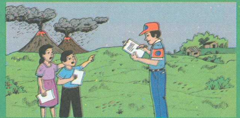
"Informemos de daños y sigamos las instrucciones de CONRED, comités de emergencia y otras autoridades"