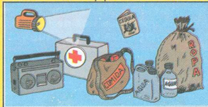
"Mantengamos a mano una linterna y radio con baterías nuevas, agua, alimentos, botiquín, un poco de ropa y documentos importantes como cédulas y escrituras"