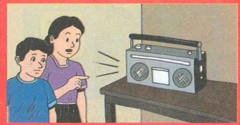
"Mantengámonos informados. Sigamos recomendaciones que nos den CONRED, comités de emergencia y otras autoridades"