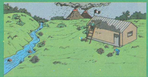
"Si podemos salir, limpiemos cenizas y arena de techos y cauces de agua. Revisemos posibles daños"