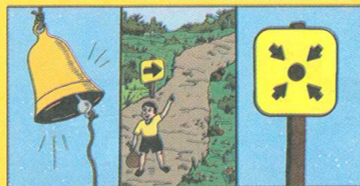
"Debemos conocer las señales de alarma, vías y lugares de evacuación y puntos de concentración"