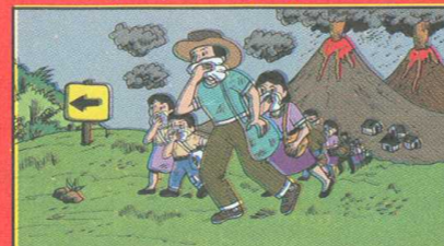
"Evitemos respirar gases y polvo de volcán. Usemos trapos húmedos en agua con vinagre o mascarillas protectoras"