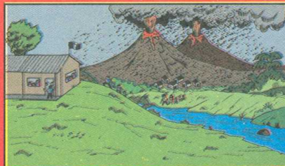
"Busquemos refugio bajo techo. Caminemos al albergue o a lugares altos, lejos de cauces de ríos"