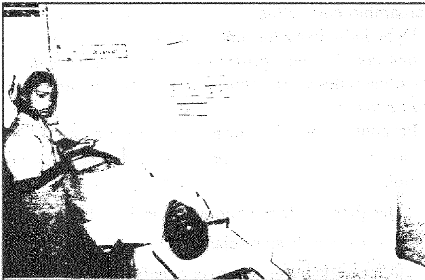
Niños y niñas mientras dramatizan la dinámica de las pérdidas.

Para culminar la dinámica, el(a) profesor(a) deberá resumir lo que es una actitud positiva y adecuada ante esa situación, a partir de las ideas y opiniones de los niños y niñas. Hará énfasis en que las pérdidas y los desastres son problemas que se pueden presentar en la vida, por lo que