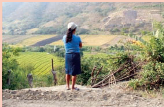
Foto 12: Vista de cultivos orgánicos en el distrito de Montero.

“Se abre la oportunidad del Fondo Contravalor Perú Alemania. Nosotros, con el apoyo de IGCH (...), carecíamos de instrumentos técnicos, como un plan de ordenamiento territorial, pero nos presentamos a ese concurso (...) y resultamos ganadores, calificamos y pudimos desarrollar estos instrumentos de gestión. Esos instrumentos nos han servido para tener una mejor visión y planificar el desarrollo local, orientando los recursos para resolver problemas comunes.” 15