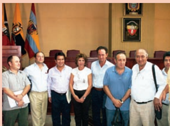
foto 13: Reunión con Mancomunidades del Ecuador.

Desde la mancomunidad existe también un interés para establecer una mayor relación con las mancomunidades de Ecuador, en la medida en que se constituyen en aliados para los procesos de negociación e incidencia que se puedan establecer a nivel regional.