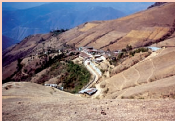
Foto 9: Procesos de desertificación. Distrito Lagunas.

“Aquí los agricultores hacen labores tecnificadas, algunos abonan. Y el agricultor que no está organizado, no hace poda ni limpieza a su cafetal, entonces esos cafetales están débiles, y esta humedad, esta lluvia, les pega un hongo, una enfermedad que es el ojo de gallo, que hoja y el grano se cae. Pero en agricultores que conocen de técnicas (...) poquísima es la diferencia, se les cae un mínimo.” 9