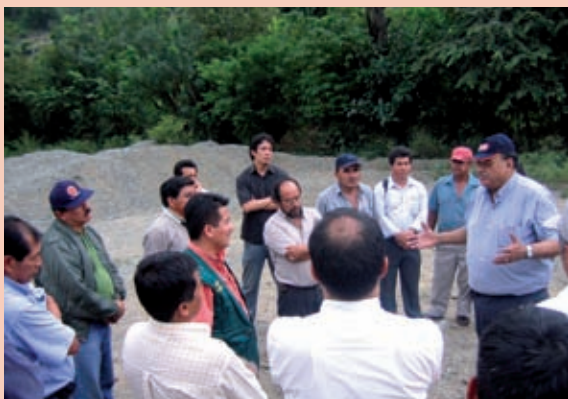
Foto 8: Acuerdos con el Gobierno Regional y la mancomunidad. Distrito de Paimas.

La conformación de la mancomunidad Señor Cautivo de Ayabaca, integrada por los alcaldes distritales de la provincia de Ayabaca, parte del reconocimiento de una problemática de carácter común que demandaba ser resuelta de manera conjunta. La gestión articulada es vista como un mecanismo de respaldo mutuo para disponer del apoyo y atención necesarios desde el nivel provincial y regional.