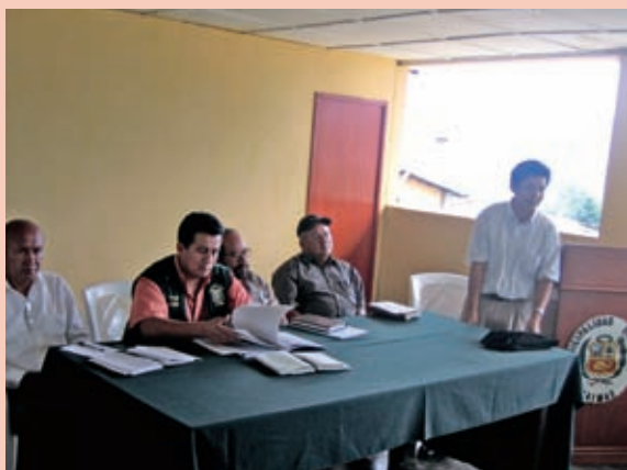
Foto 11: Reunión de miembros de la mancomunidad.

Como parte del cumplimiento de estos objetivos se han llevado a cabo diversas actividades apoyadas por las instituciones de desarrollo que, aún cuando se realizan de manera aislada, contribuyen a disminuir de manera indirecta ciertas condiciones de riesgo. Así, se ha promovido el desarrollo sostenible de la zona y algunas prácticas transformadoras de las condiciones de riesgo, especialmente las asociadas al recurso hídrico y forestal. Estas acciones constituyen los primeros pasos tendientes a promover propuestas integrales de gestión del riesgo, en la medida que se vaya entendiendo e incorporando la temática de manera integral.