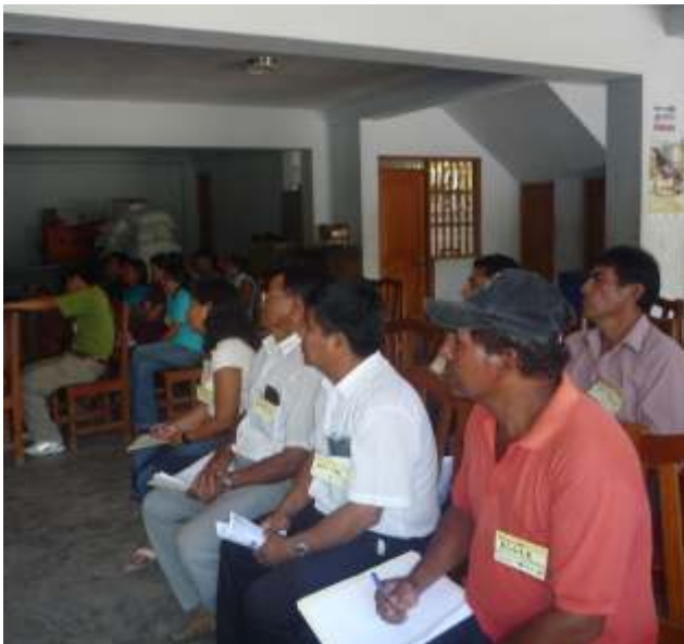
Reuniones permanentes con los pobladores para designación de responsabilidades en el Comité de Defensa Civil