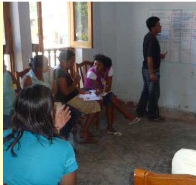
Formulación de Plan Operativo de trabajo