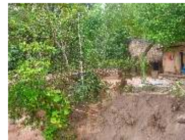
Zona vulnerable a deslizamiento

Es una construcción social, la condición de susceptibilidad a resultar dañadas o afectadas que tienen algunas comunidades o sociedades, la vulnerabilidad se expresa en formas físicas y en formas de actuar en relación al medio natural, se va configurando en el proceso de desarrollo de los pueblos, es determinada por el modelo de desarrollo que adopta cada país, el modelo es la forma como están definidas las políticas que orientan la actuación de los actores de desarrollo, condiciona la actitud y la práctica de las empresas, personas y capacidades. Las decisiones y acciones que realizan los actores de desarrollo producen vulnerabilidad.