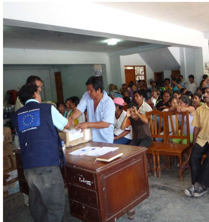
Preparativos ante emergencias

Las Comisiones Técnicas del Comité de Defensa Civil funcionan permanentemente (no solo en emergencias) y dependientemente de las acciones del Comité formulan su Planes Operativos de Trabajo.