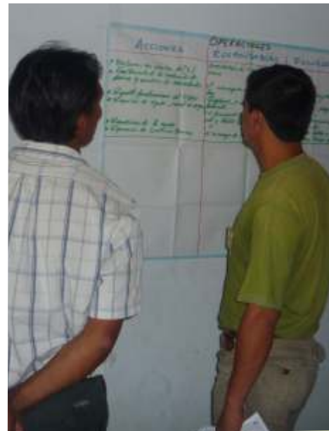
Formación de las comisiones de Defensa Civil de Shamboyacu