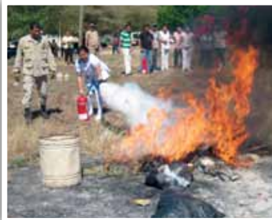
Intervenciones en el Centro de Salud Médico-Odontológico (CESAMO) Dr. Carlos Pinel en Honduras.