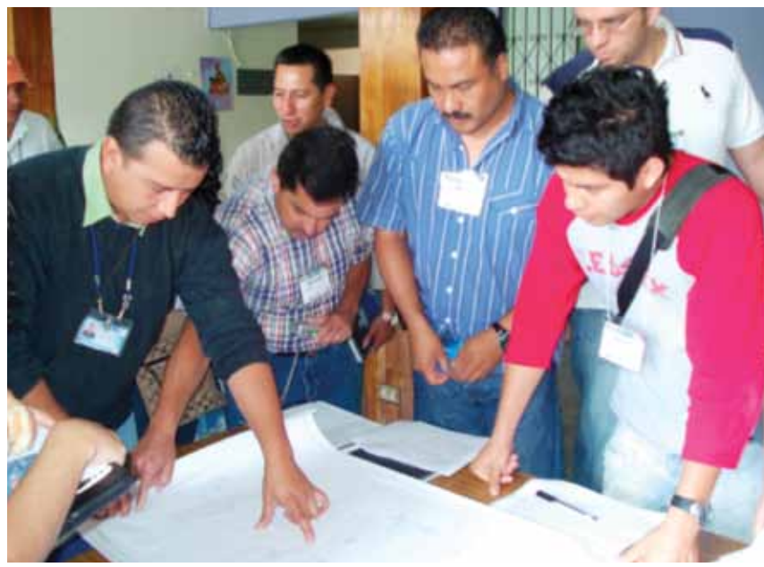
Taller de evaluadores del Índice de Seguridad Hospitalaria en el Hospital de Cobán, Guatemala.

Para crear y mejorar la capacidad técnica local, los países formaron equipos de evaluadores que utilizan el Índice de Seguridad Hospitalaria (ISH). Estos equipos están formados por diversos actores de organismos responsables de la gestión de riesgo a desastres, docentes y estudiantes universitarios (específicamente de la carrera de ingeniería), organizaciones no gubernamentales y personal de los ministerios de salud e institutos de seguridad social y fuerzas armadas, dependiendo de la realidad y necesidades de cada país.